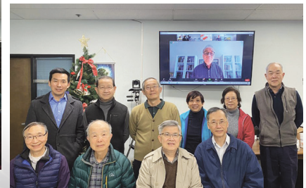
「聖言」董事與主要同工