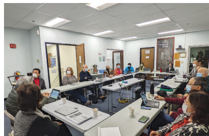
事工策略重整會議進行的情景